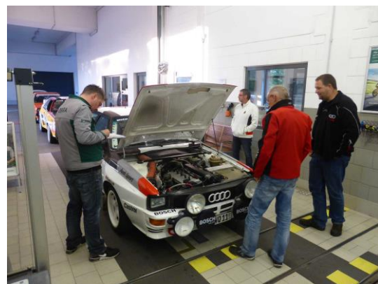
Audi quattro von Walter / 1.buc-Süd